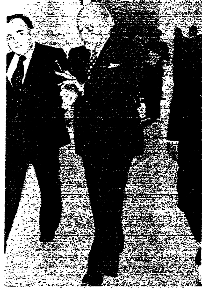
الرئيس بجلي والجنرال لوزي الذي يقابلها قصر بعبدا امس